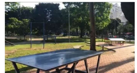
Criação área Jovem–Futemesa e Pingpong