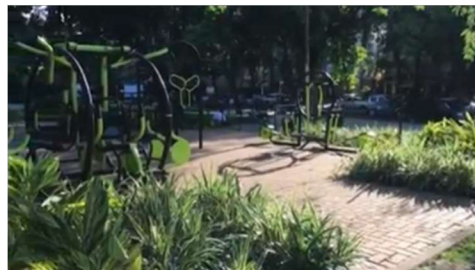
Remanejamento e reforma da ATI