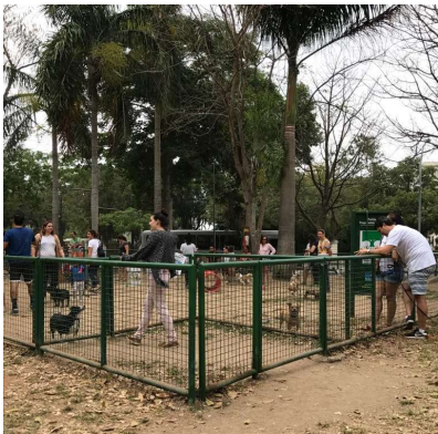
Parcão - Manutenção

No período de março 2018 a março 2020 A Amagavea adotou a Praça Santos Dumont. Nesse período a Praça foi toda reformada em parceria com empresas locais e Prefeitura. Só não foi possível reativar o Chafariz.