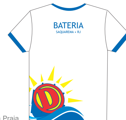
Marca e camisa do evento Desliga na Praia