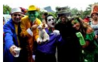
Bom humor, irreverência e muita alegria são a marca registrada do bloco Desliga da Justiça.