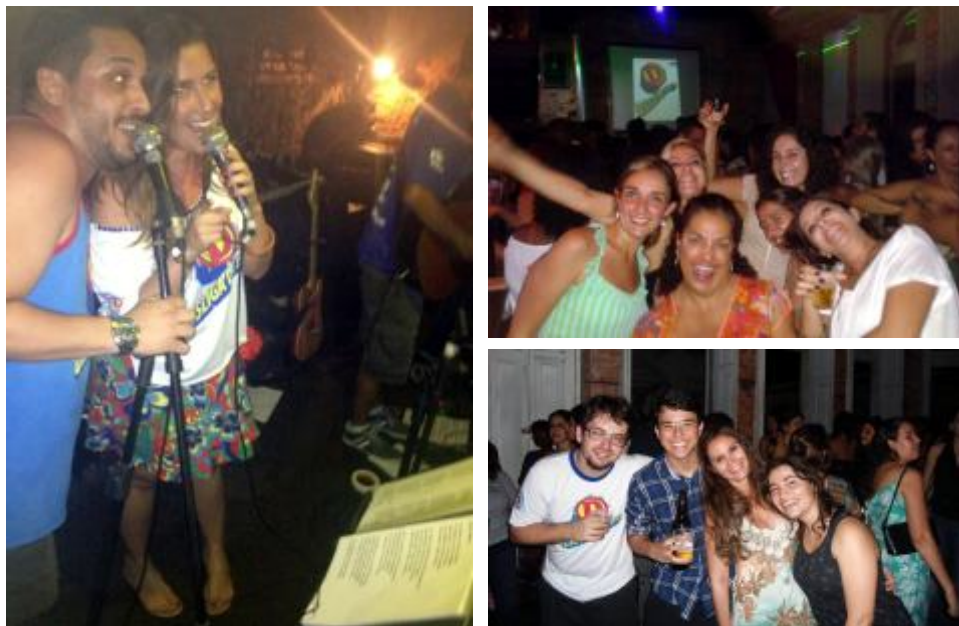
Primeiro evento da programação 2013/2014.

O Bloco Desliga da Justiça vem crescendo exponencialmente e a necessidade de uma seriedade e profissionalização se tornou palavra de ordem. Com uma diretoria definida alinhada com a harmonia e bateria, o bloco vem se destacando no meio musical de Blocos de Carnaval de Rua. Estão programados eventos mensais do bloco até dezembro de 2013 e, em janeiro, a ideia são ensaios abertos, criando assim um verdadeiro show de programação para os foliões.